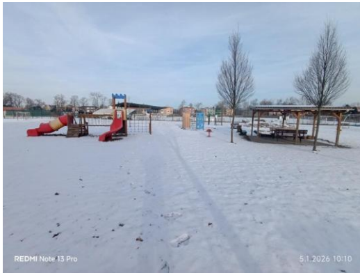
HŘIŠTĚ S HERNÍMI PRVKY